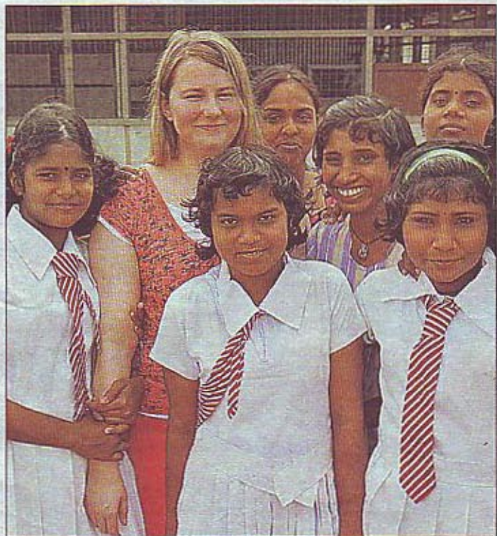
Natascha Kampusch mit Tsunami- und Kriegswaisen

Eines dieser Projekte ist das Zentrum „Bosco Sevana“ in Uswetakeiyawa, das Natascha Kampusch in der vergangenen Woche besucht hat (ORF-„Thema“ sendet darüber am Montag eine Reportage). In diesem Zentrum bekommen Schulabbrecher eine Ausbil-